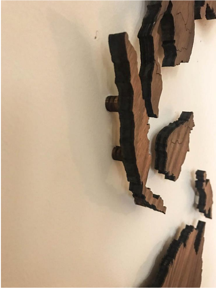
8. Het eindresultaat van de wereldkaart in gefineerd noten.